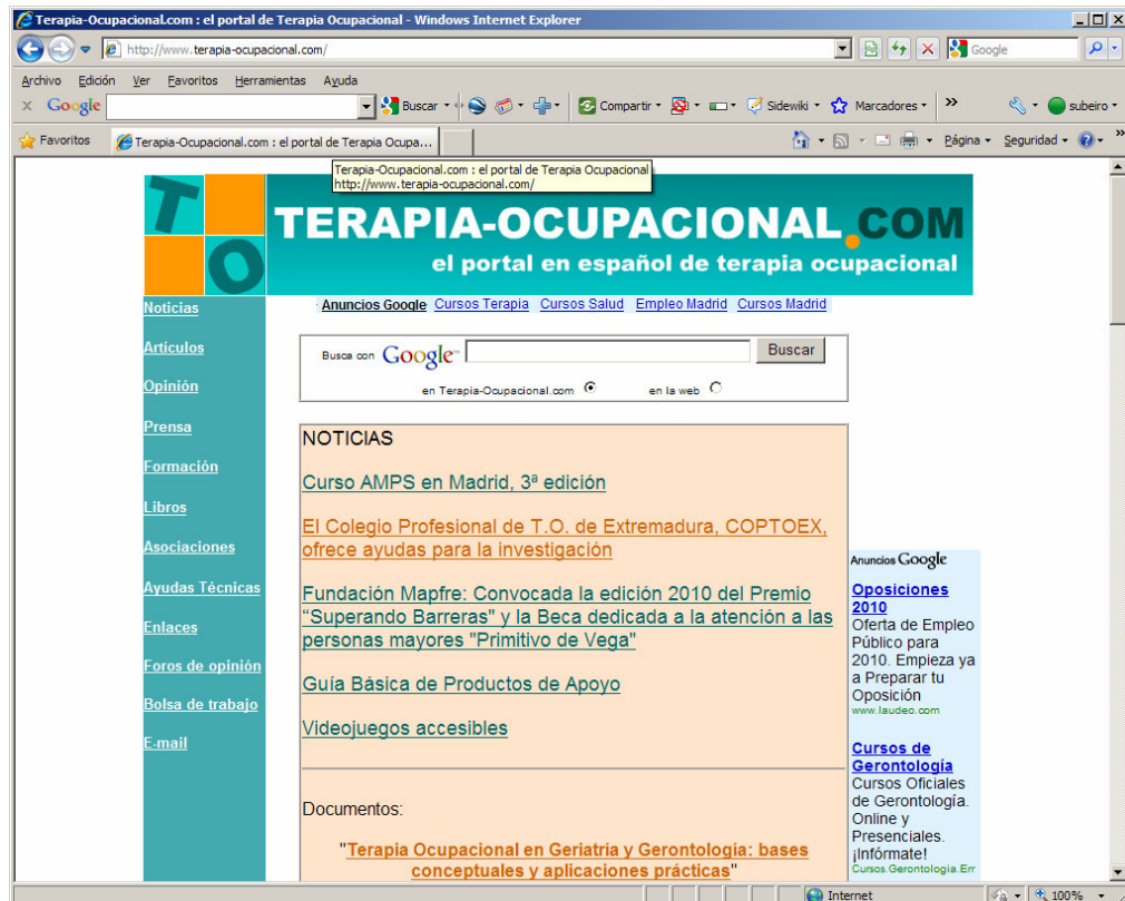
www.Terapia-Ocupacional.com en el año 2010